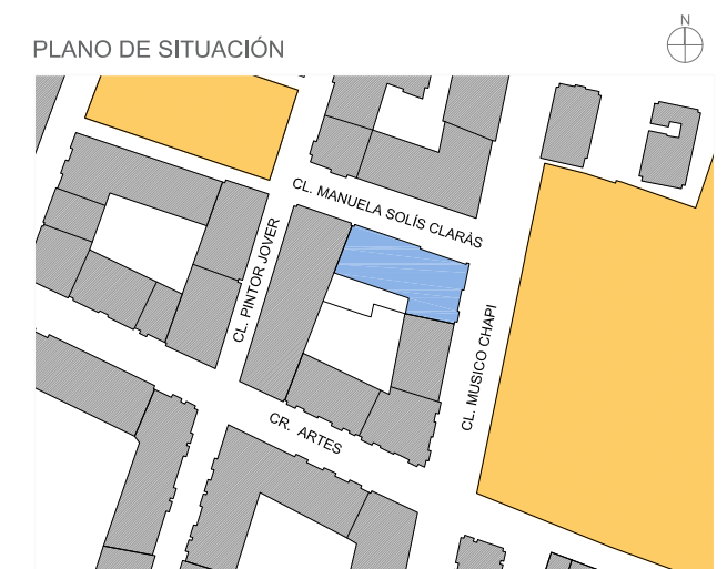
ESQUEMA EN PLANTA