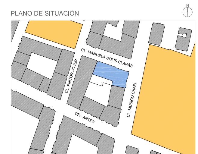
ESQUEMA EN PLANTA